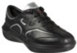
kyBoot Jindo Grössen 35 bis 47

Sie begeistern und jeder weitere noch viel mehr.